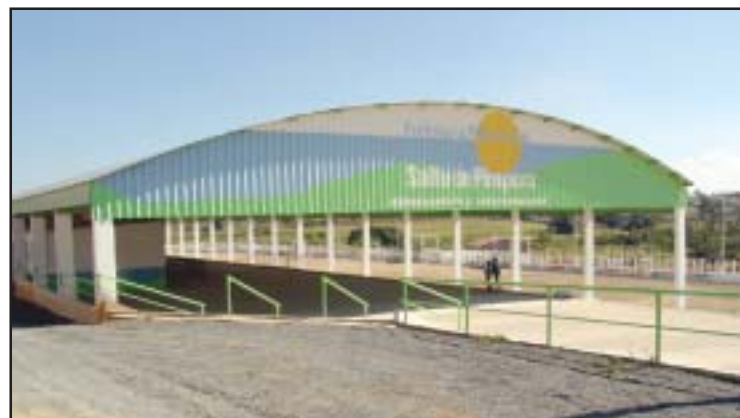
Hoje, o recinto depois das melhorias