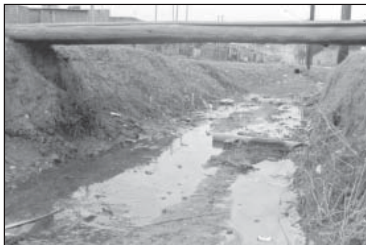
Ponte improvisada usada no passado pelos moradores