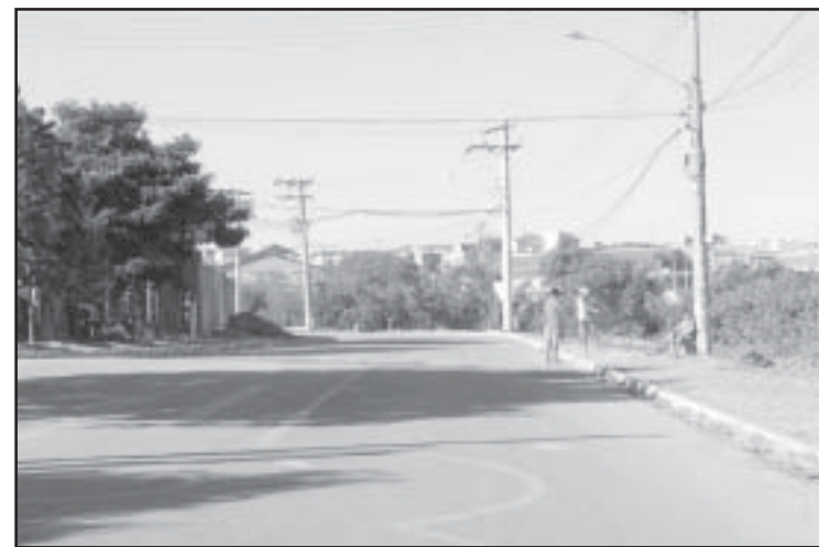
Obra atendeu antiga reivindicação de moradores

A administração municipal elaborou um plano de pavimentação asfáltica no início do ano passado e, muitas das obras previstas no plano já foram concluídas ou iniciadas. No Jardim Conde Francisco Matarazzo, por exemplo, foram implantadas guias, sarjetas e, depois da devida preparação, as ruas receberam o pavimento asfáltico equivalente a 5.700 metros quadrados de área.