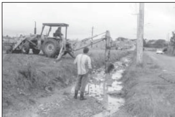
Antigo córrego que cortava o bairro

Durante muitos anos a população local sofreu com o descaso das administrações anteriores. Hoje, a realidade é outra.