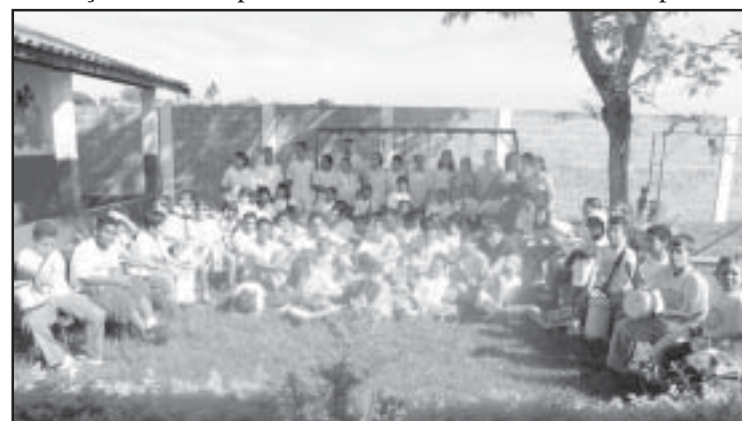
Crianças da escola especial participando de atividades

conheçamos os aspectos característicos do nosso povo.