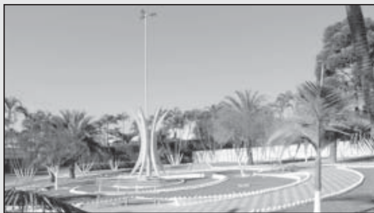
Praça Raimundo José da Silva, na entrada da cidade, foi uma das que receberam as melhorias da CPFL

Além disso, a empresa também providenciou a troca de dois transformadores no recinto de festas gratuitamente e doou 13 postes para uso naquela área pública.