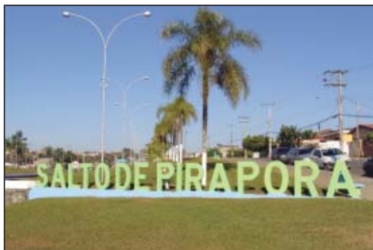
No ano do Centenário, cidade vive seus melhores dias

Este ano, quando Salto de Pirapora vai completar cem anos de fundação, dia 24 de junho, a administração municipal vem se empenhando em dar andamento a uma série de obras importantes para o município.