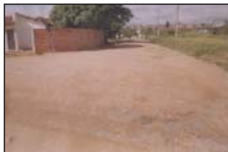
O Jardim Conde F. Matarazzo também recebeu pavimentação asfáltica