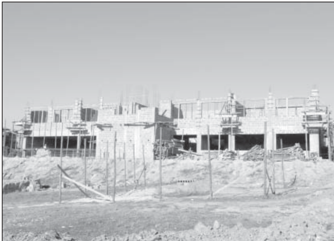
Escola de ensino fundamental em construção no Jardim América

O resultado está aí, uma obra de grande porte com visão para o futuro, pois além de solucionar o problema de um terreno que ficou abandonado por muitos anos, agora, com a construção dessa escola irá também promover maior inclusão social e dignidade aos pais e crianças daquela localidade.