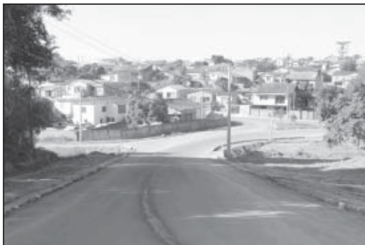
Interligação entre os bairros Paulistano e América

A melhoria, que recebeu amplo apoio das comunidades locais, não só dos dois bairros em questão, mas também dos adjacentes, jardins das Bandeiras e Cachoeira, vem facilitar