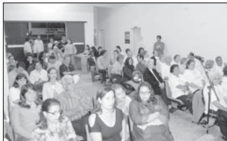
Audiências do Plano Diretor contaram com a participação de muitos munícipes

O plano deve ser um verdadeiro pacto sócio-territorial que de fato transforme a realidade da nossa cidade.