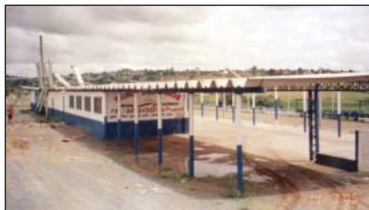
Antes, o recinto de festas em condições precárias

Outros destaques foram a criação do pregão municipal e da Imprensa Oficial do Município, que resultaram em economia considerável aos cofres públicos de Salto de Pirapora, na casa de R$ 895.277,02 a 16