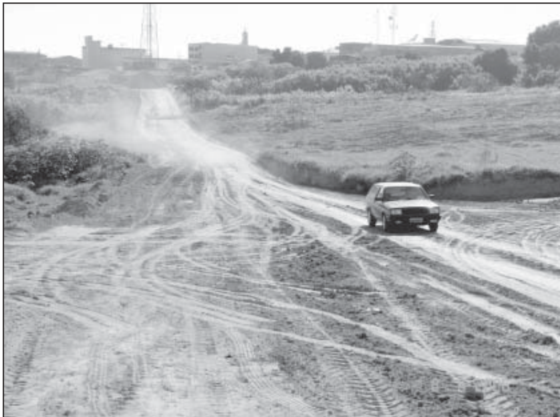
As novas ruas já estão sendo utilizadas pelos motoristas para fugir do trânsito do Centro