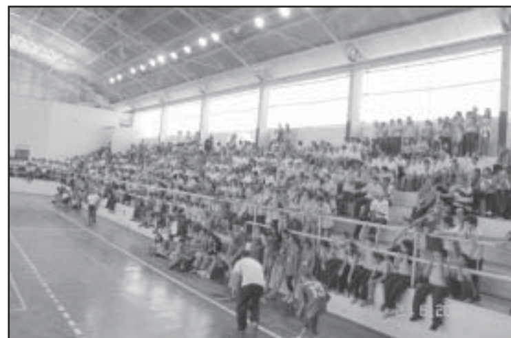
Os jogos escolares têm sido uma das atrações esportivas

Tudo isso sem contar com o incentivo que a divisão de esportes vem dando aos jovens desportistas e escolares, contribuindo nesse verdadeiro celeiro formador de atletas que hoje presenciamos em nossa cidade.