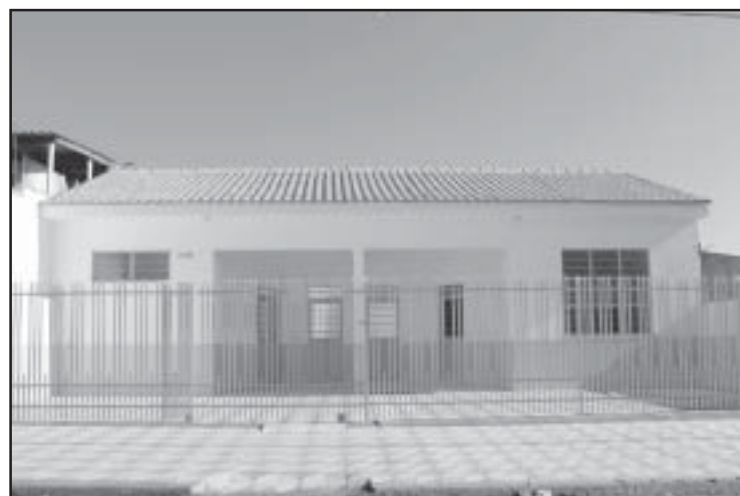
Em breve, a comunidade local estará recebendo a sua padaria comunitária da administração municipal

Outro bairro que também está sendo contemplado com a implantação da padaria comu-