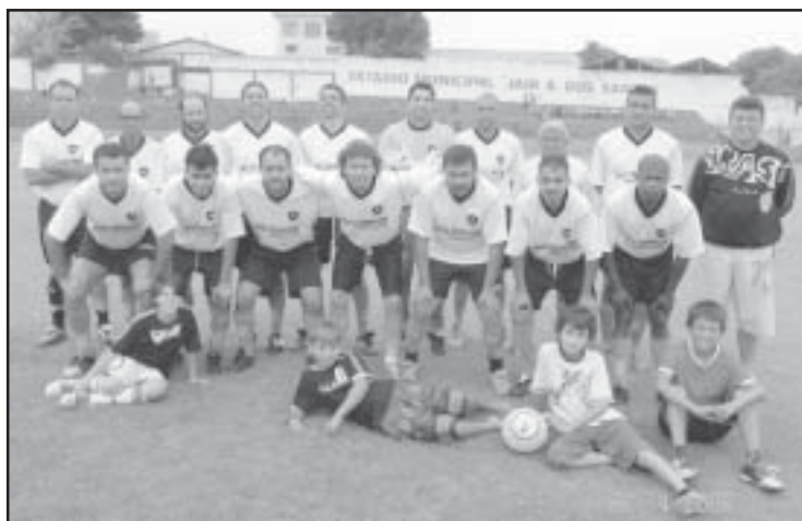
O Botafogo, último campeão do "Veteranos"