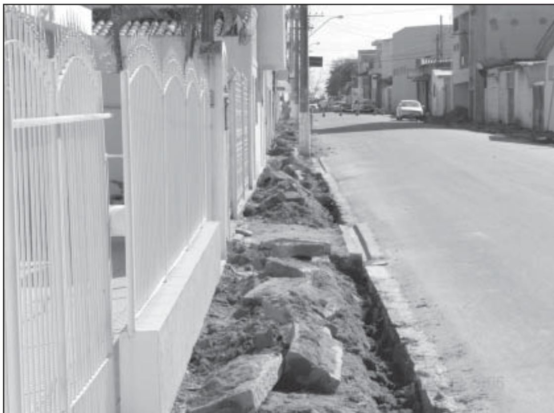
As obras de reurbanização do Centro já se encontram no fim da rua Francisco B. Leite

O novo piso será padronizado em toda a região central da cidade e, ainda, em material altamente resistente e antiderrapante. Segundo a Prefeitura, essas medidas têm recebido apoio da população. O governo municipal informou que o novo piso terá as cores amarela, cinza e vermelha.