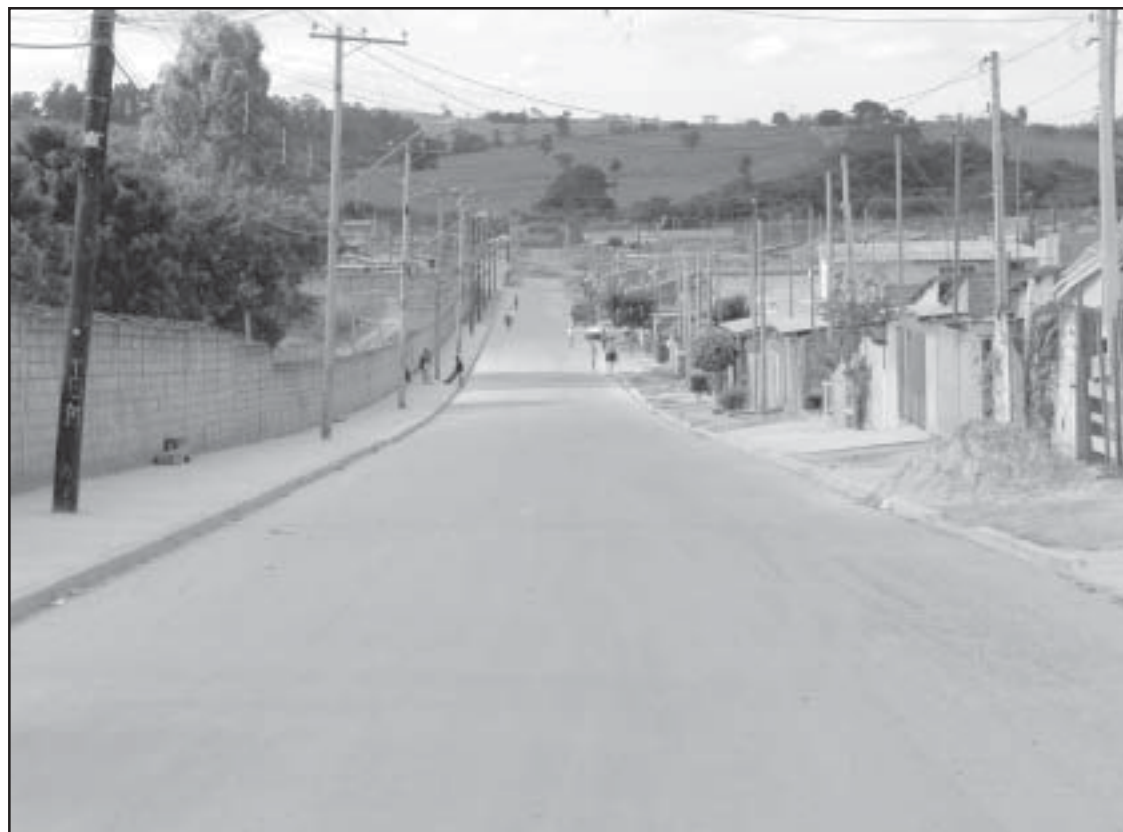
Os moradores já estão usufruindo das melhorias implantadas no bairro