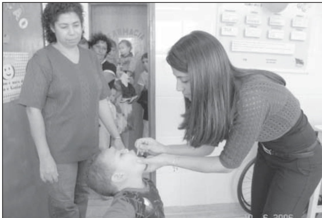
Campanhas de vacinação promovidas pela Saúde municipal têm atingido metas