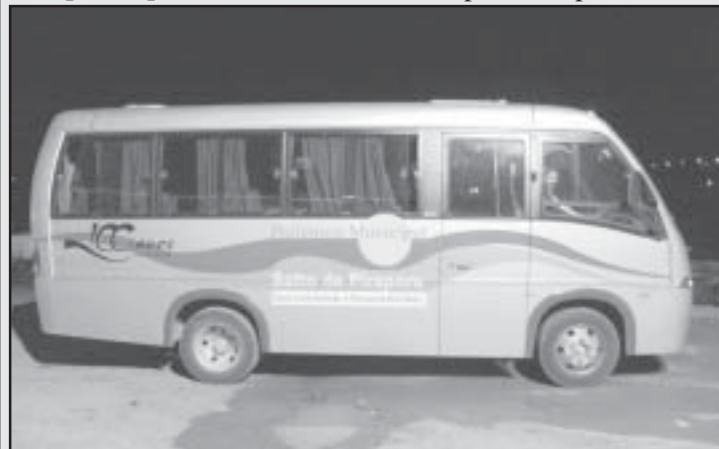
Aquisição de microônibus para transporte de pacientes

dimento especializado em grandes centros, como São Paulo, por exemplo.