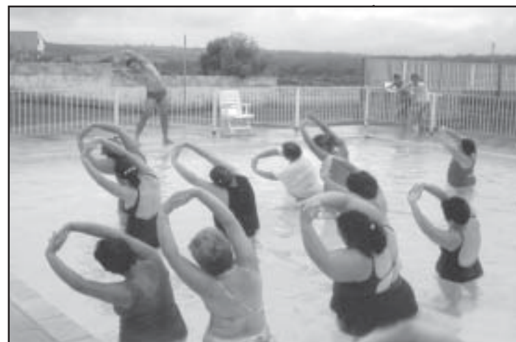
A comunidade aprovou a iniciativa dos PSFs

O objetivo da hidroginástica é melhorar o condicionamento cardiorespiratório, força muscular, equilíbrio e postura dos praticantes. As comunidades aprovaram e aderiram à iniciativa, comprovado pelo crescente número de partici-