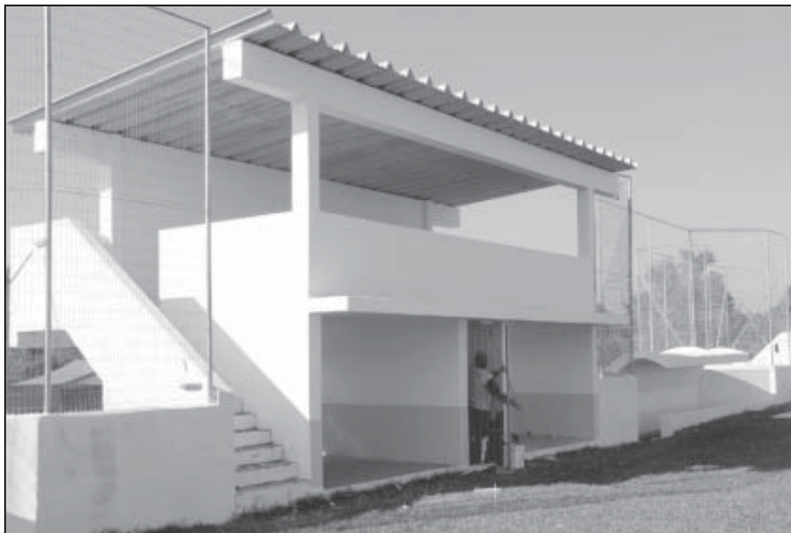
O Estádio Vicente Leme dos Santos foi praticamente reconstruído pela Prefeitura