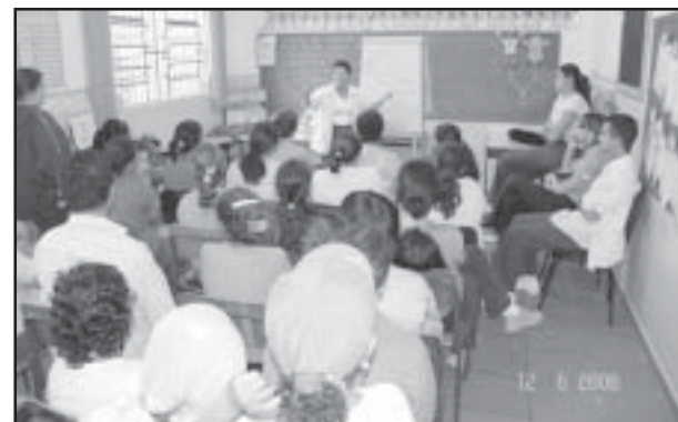
A comunidade tem aprovando os projetos

A Escola Municipal de Educação Especial Profª. Benedicta Cannavan Benedetti vem realizando projetos de caráter educativo, incluindo a família e a comunidade. O projeto tem como objetivo o esclarecimento das pessoas que lidam com situações especiais.