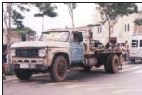
A frota municipal foi completamente reformada, exemplo do caminhão acima