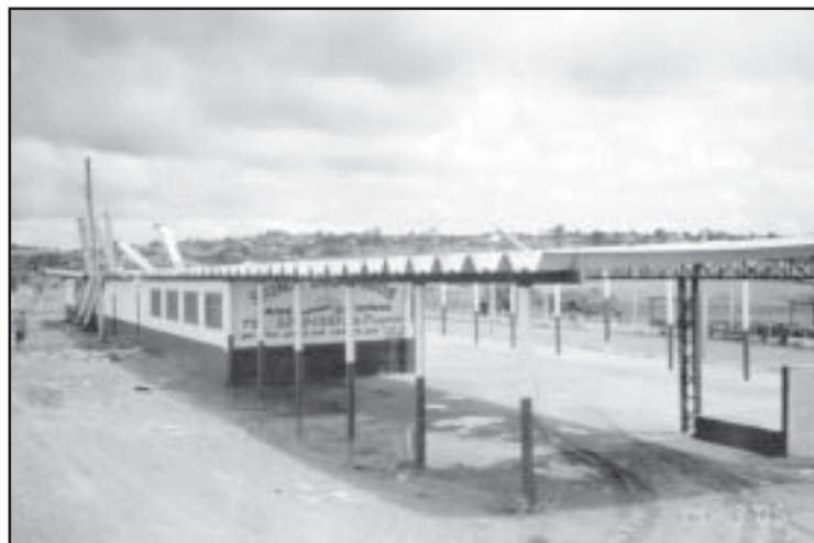
Setor de churrascaria, antes das reformas