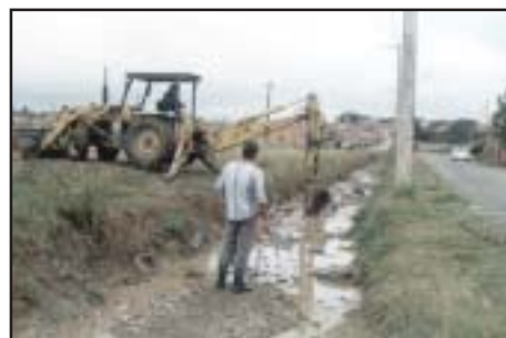
O Jd. Teixeira antes e, hoje, depois das providências da administração municipal