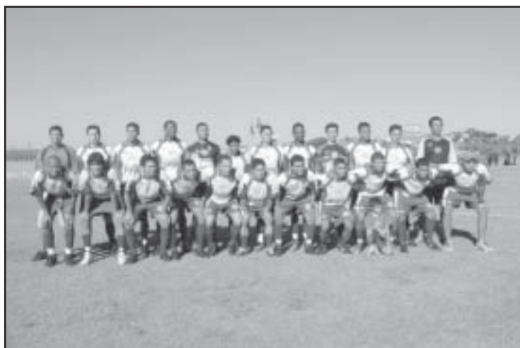
O Almadina, de Boituva, campeão do Intermunicipal