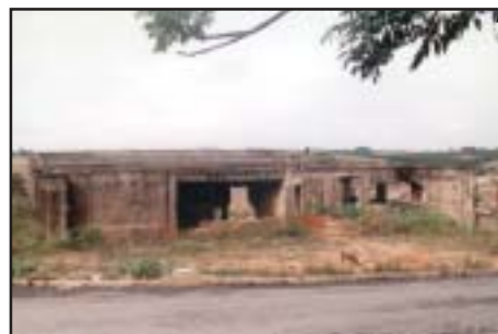
O Centro Comunitário, no Campo Largo, que por décadas ficou abandonado