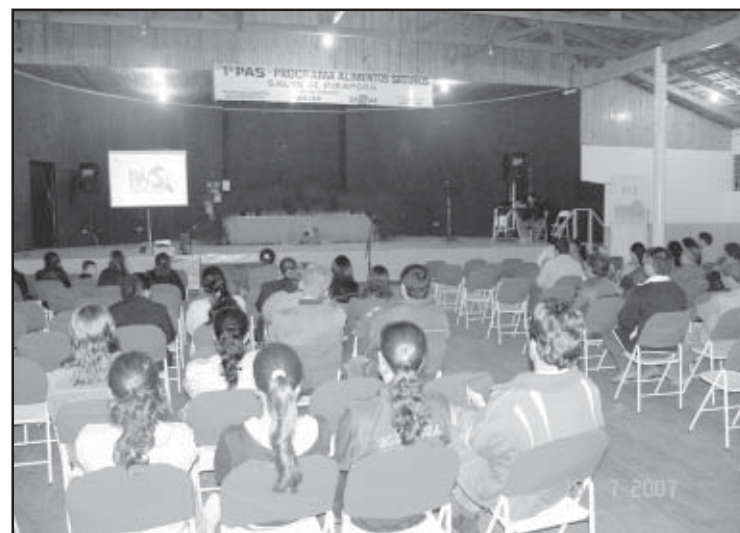
Comerciantes ouviram com atenção as orientações do PAS

O Programa Qualidade na Mesa é composto por várias ações, sendo as principais o Programa Boas Práticas – Segurança de Alimentos; Formação de Multiplicadores para