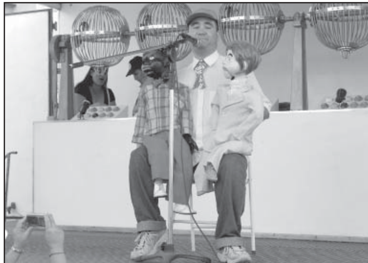
Uma das atrações foi o show de ventríloquo local

Outro ponto de destaque foi o bilhete da loteria paulista que teve impresso imagens locais pela primeira vez na história do município.