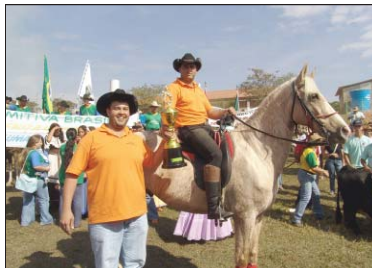
Comitiva Chora no Gogó foi uma das premiadas