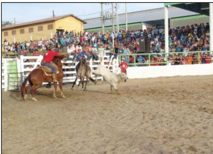
Provas campeiras são atração à parte na festa do peão