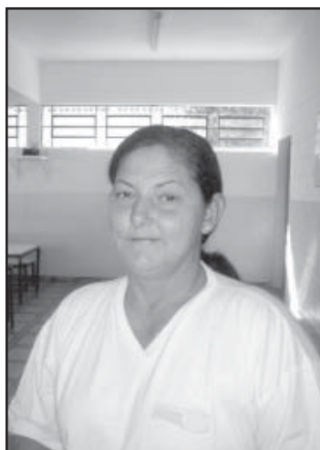
Ganhadora da TV no sorteio