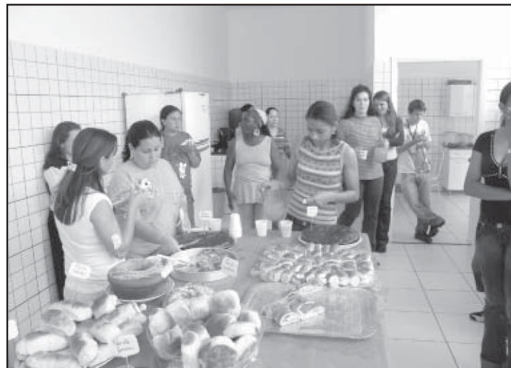
Formandas da padaria do Jardim Ana Guilherme

ção do projeto, a idéia é agora, com o curso concluído, que os participantes possam produzir em suas próprias casas alimentos para a comercialização e assim gerar uma renda comple-