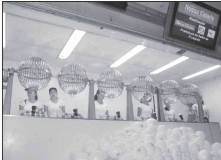
O esperado momento do sorteio da Loteria Paulista