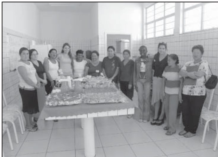
Formatura na padaria comunitária do Jardim Teixeira