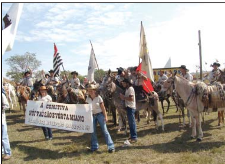
Comitivas se reuniram no recinto depois do desfile