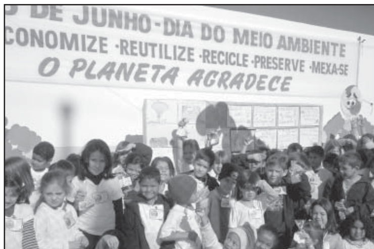
Escola programou atividades no dia do meio ambiente

A escola municipal Jana Marum dos Santos foi a primeira da cidade a realizar uma festa nos novos galpões do Recinto Antonio Carlos Farrapo. No dia 2 de junho a escola promoveu a Festa do Pastel no local, que envolveu toda a equipe escolar daquela unidade e os alunos de segunda fase da pré-alfabetização às quartas séries. Com isso, pode-se dizer que a Jana Marum abriu o calendário escolar de festejos juninos e julinos em Salto de Pirapora, além da utilização do recinto de festas para esse tipo de evento, até então, uma no-