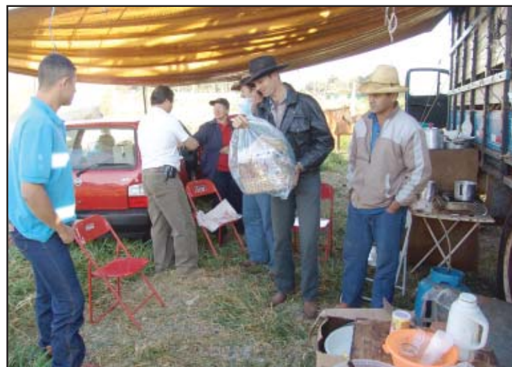
Comissão entregou cestas de alimentos aos acampados

PREFEITURA MUNICIPAL DE SALTO DE PIRAPORA VISITE O NOSSO SITE: www.saltodepirapora.sp.gov.br