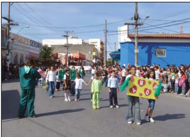
Desfile cívico-militar foi um dos pontos altos do aniversário

No encerramento da festa todos vibraram com o espetáculo pirotécnico que fechou com chave de ouro um dos maiores eventos culturais já realizado em Salto de Pirapora.