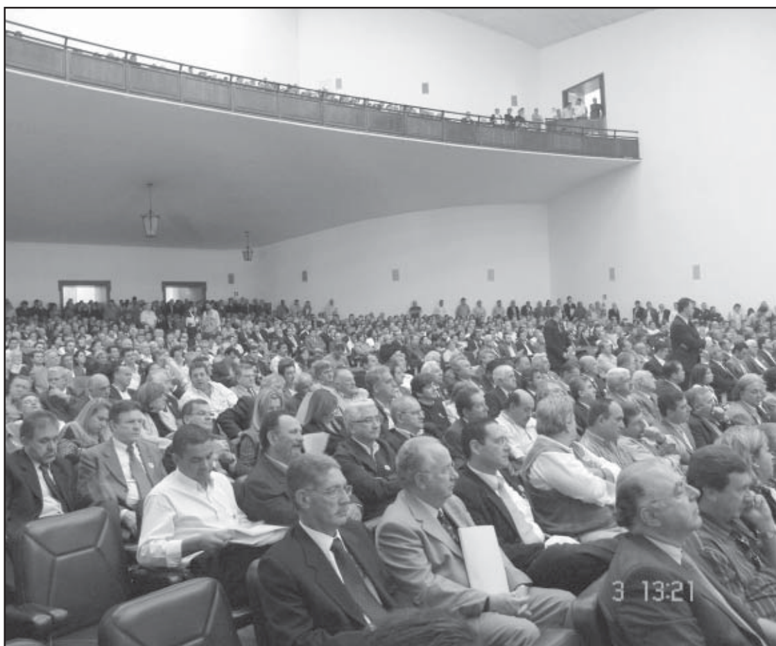
Prefeitos e outras autoridades no lançamento do programa Município Verde

A cidade de Salto de Pirapora aderiu ao programa Município Verde, que faz parte dos 21 Projetos Ambientais Estratégicos do Governo do Estado de São Paulo. O protocolo de adesão ao programa foi assinado no início do mês de julho, no Palácio dos Bandeirantes em São Paulo.