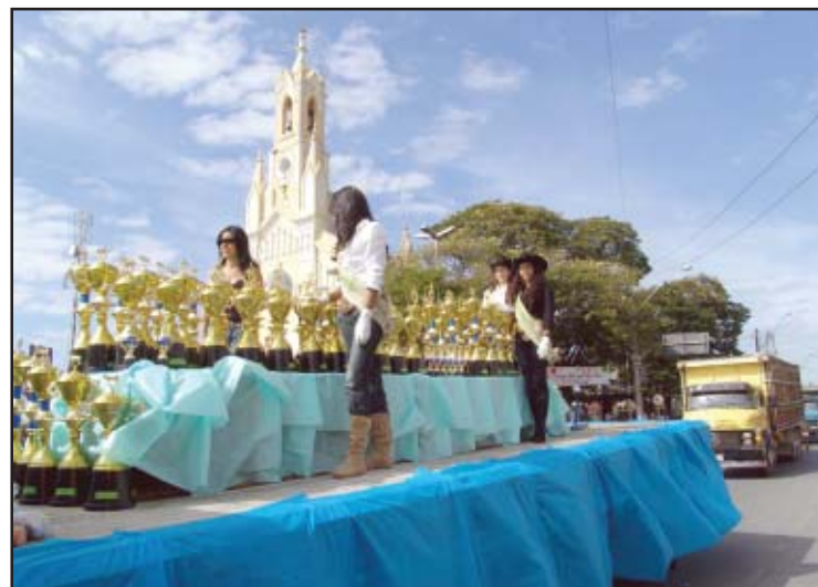
Desfile de cavaleiros foi um dos destaques da festa do peão