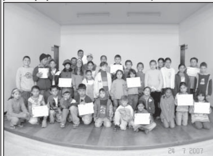
As crianças formandas da primeira turma de artesanato

O Centro de Referência da Assistência Social (CRAS) realizou a cerimônia de formatura das primeiras turmas do curso de artesanato infantil. O evento aconteceu no dia 24 de julho no próprio CRAS e formou 56 crianças.