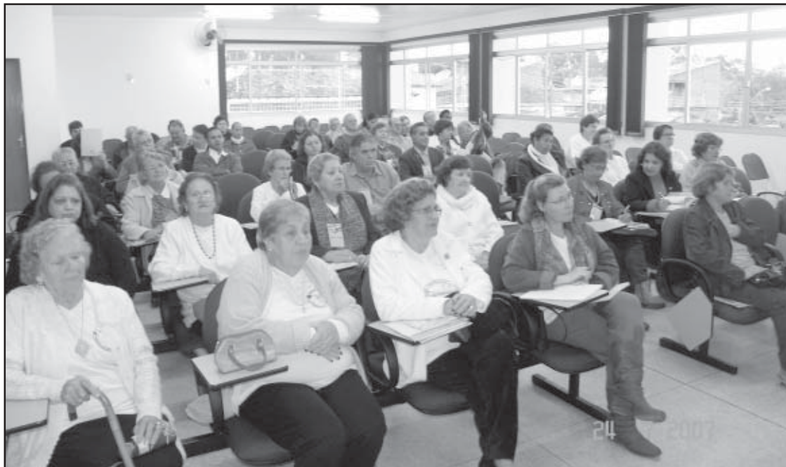
O encontro aconteceu no Centro de Referência da Assistência Social (CRAS)

A Comissão Eleitoral do Conselho Estadual do Idoso (CEI) reuniu-se terça-feira (24/7), das 13h às 17h, com representantes dos conselhos municipais do idoso existentes hoje na região 12, na qual Salto de Pirapora está incluída. O encontro ocorreu no CRAS de Salto de Pirapora.