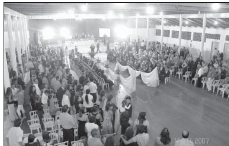
Formatura da 8ª série da José Marcello: 90 formandos

Fernandes de Andrade, Maria Rizzi Canalle e Quintas de Pirapora. A diretoria da educação também realizou a formatura na 8ª série de 90 alunos da escola municipal professor José Marcello. Foi a primeira turma de formandos desse estabelecimento escolar.