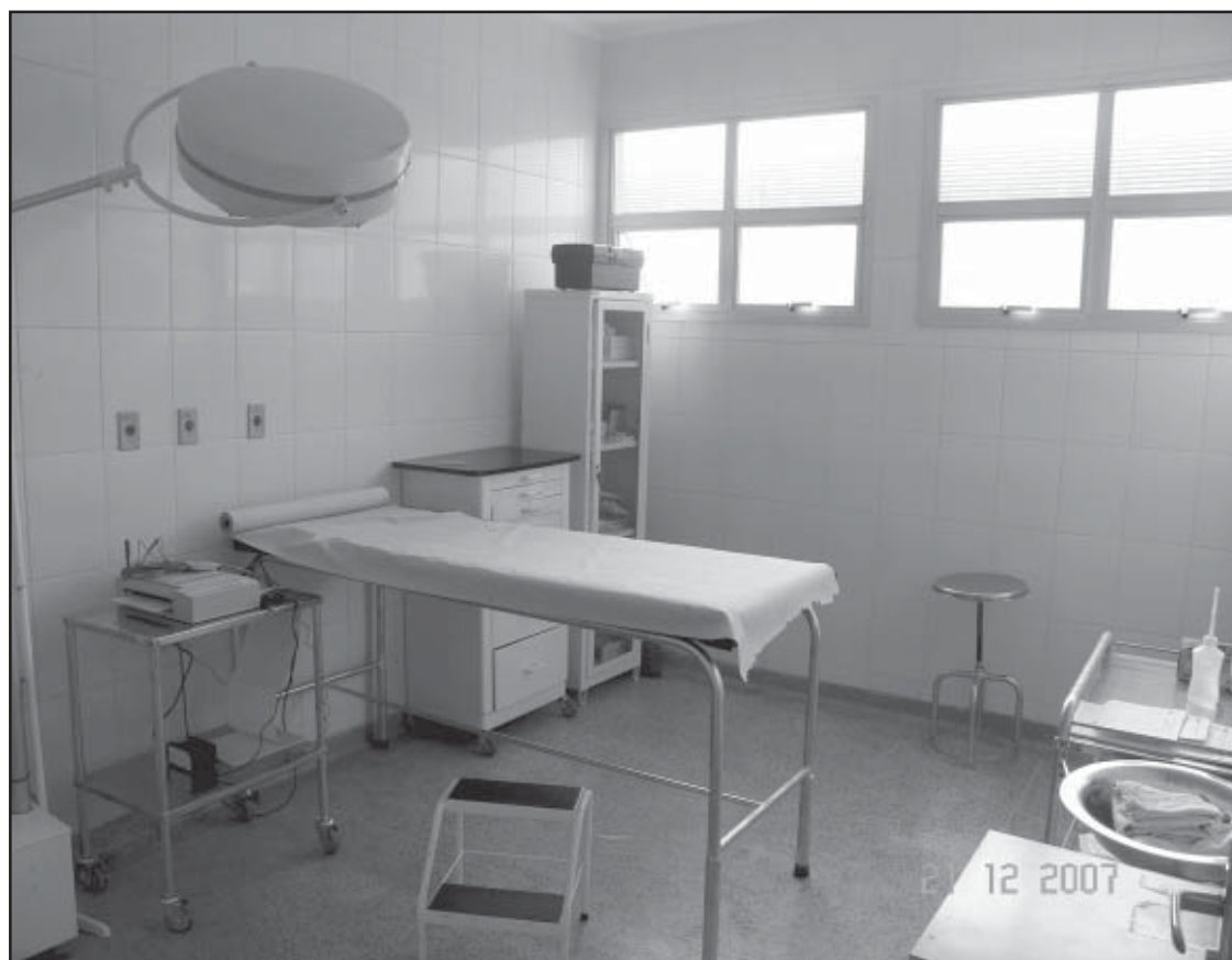
Agora o centrocirúrgico do Centro Médico está em melhores condições de atendimento

tar o melhor atendimento possível à população, a diretoria de saúde também adquiriu novos equipamentos este ano, sendo os principais os seguintes: para a Maternidade Municipal: um aparelho de ultrassonografia, dois oxímetros de pulso, um aminioscópio e um aspirador cirúrgico; para a Vigilância Epidemiológica: duas câmaras para conservação de vacinas; para o Laboratório Municipal: um microscópio, uma estufa de secagem, uma centrífuga de bancada, uma centrífuga para microhematócitos; para o Centro Médico: um bisturi eletrônico, um eletrocardiógrafo, um colposcópio; para o pronto-socorro da Santa Casa: um eletrocardiógrafo, um aspirador cirúrgico, um monitor cardíaco multiparamétrico e um ventilador eletrônico.