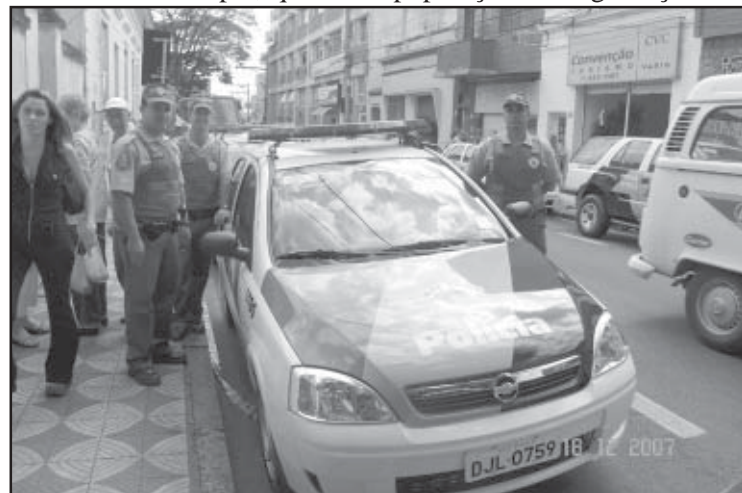
Policiais e a nova viatura destinada ao município

seja colocar à disposição da população saltopiraporense melhores condições de segurança. A administração municipal vem se empenhando no sentido de estabelecer parcerias entre as polícias civil e militar e a Guarda Municipal, visando atender os anseios da população em segurança.