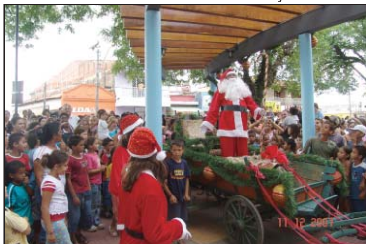
Chegada do Papai Noel atraiu mais de mil pessoas

Por onde passou, o bom velhinho entregou presentes e doces às crianças.