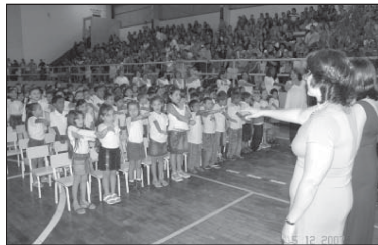
Certificados para 630 crianças da pré-alfabetização

As escolas da rede municipal de ensino formaram 720 alunos em 2007. Este mês, aconteceram as entregas dos certificados para 630 crianças que concluíram a pré-alfabetização nas escolas municipais