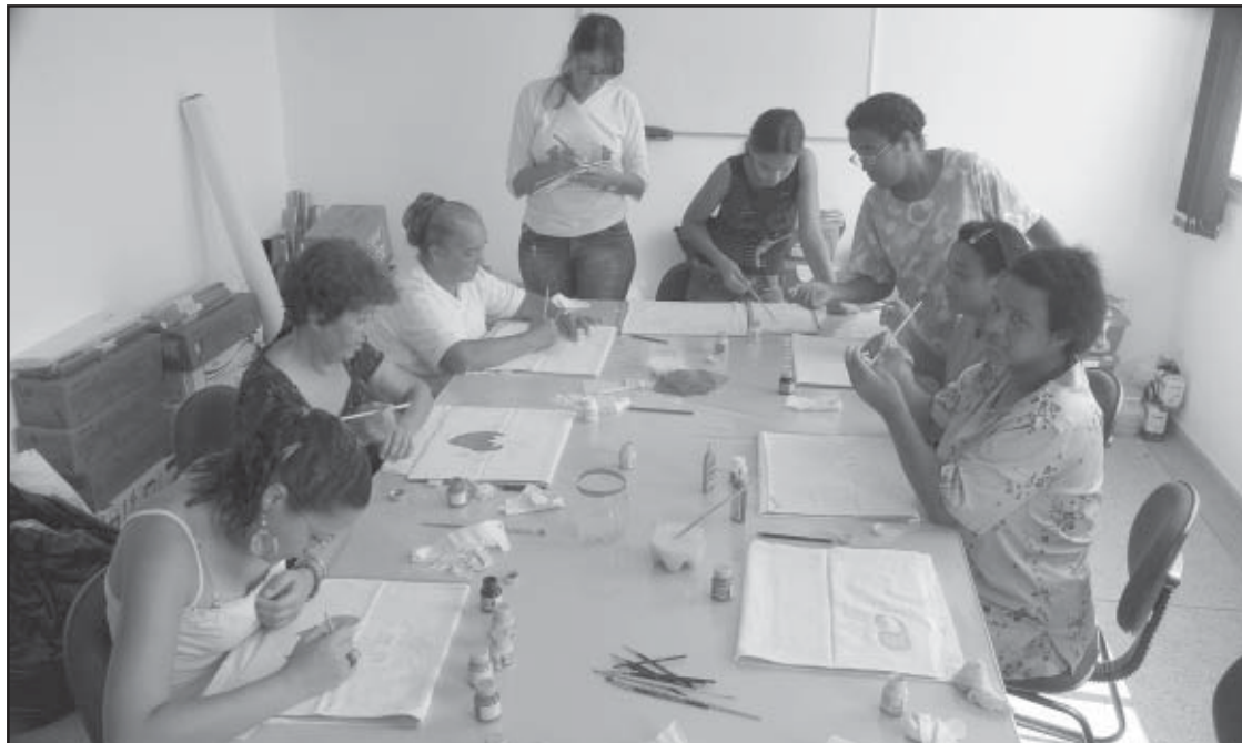
O curso de pintura em tecidos é um dos mais procurados no Cras

Muitos desses munícipes atendidos pelos projetos da Assistência Social da Prefeitura de geração de renda e inclusão social, até mesmo famílias inteiras, já vivem da renda obtida com o trabalho e as vendas do que passaram a produzir depois de terem participado dos cursos.