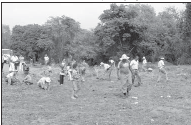
Crianças do CVC plantaram mudas no Jd. Teixeira

Colaborar para a recuperação do parque natural e cha-