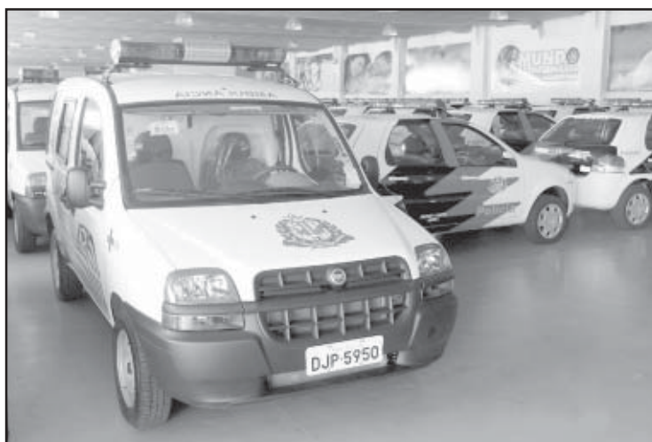
A ambulância, Fiat Doblô, para reforçar os atendimentos urgentes