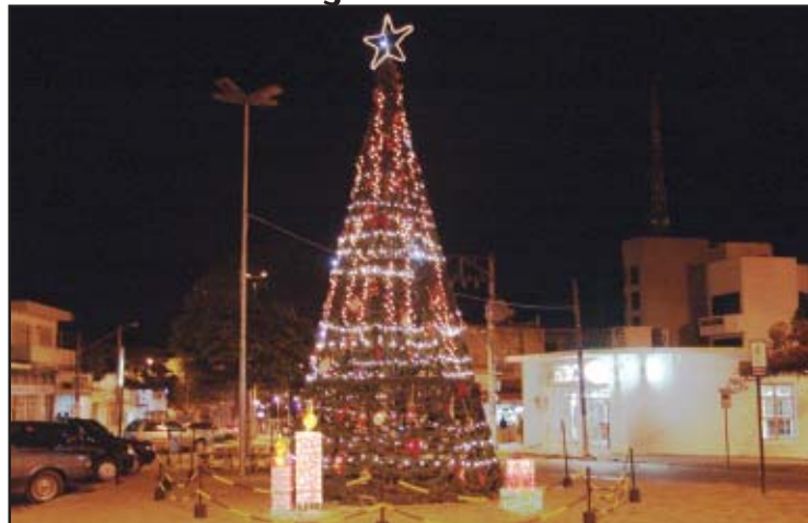
Árvore de Natal gigante tem atraído a atenção de todos

A decoração natalina de Salto de Pirapora vem rendendo muitos elogios à administração municipal. A cada ano, o atual governo municipal vem melhorando a decoração de Natal na cidade e isso tem agradado a população e os visitantes. Observa-se hoje muitas famílias reunidas nas praças centrais da cidade e encantando-se com a decoração e é comum a presença de pessoas fotografando o presépio e a árvore de Natal gigante na Praça da Matriz e a decoração e o chafariz da recém revitalizada Praça Elpídio Marcello, a Praça da Fonte.