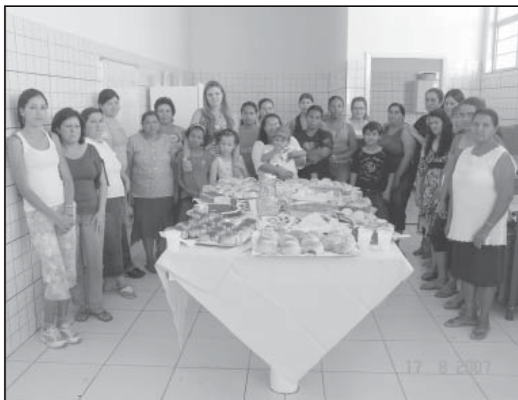
Formatura de uma das turmas de panificação

A padaria do Jardim Teixeira leva o nome de Benedita Leite de Andrade e já representa numa importante unidade municipal para auxiliar na geração de renda dos moradores do bairro. A comunidade do Jardim Teixeira teve na administração atual, o privilégio de receber diversas obras importantes. O bairro não dispunha de asfalto e hoje 100% de suas ruas já foram pavimentadas, sem custo para seus moradores.