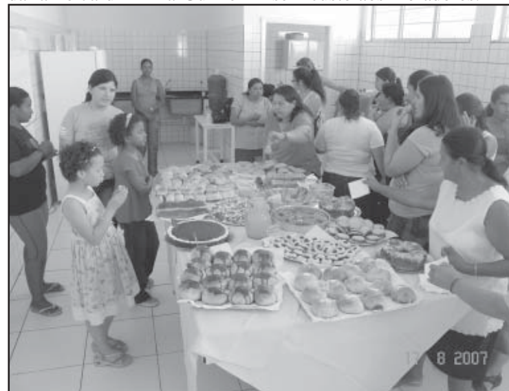
Famílias já vivem da renda com a venda dos pães

O Jardim Ana Guilherme também teve suas ruas totalmente asfaltadas, igualmente sem custo aos moradores.