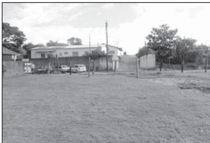
Esgoto corria a céu aberto, agora está resolvido

A Prefeitura Municipal de Salto de Pirapora construiu um sistema de tratamento de esgoto para atender a Escola Estadual Bairro da Barra. Essa era uma antiga reivin-