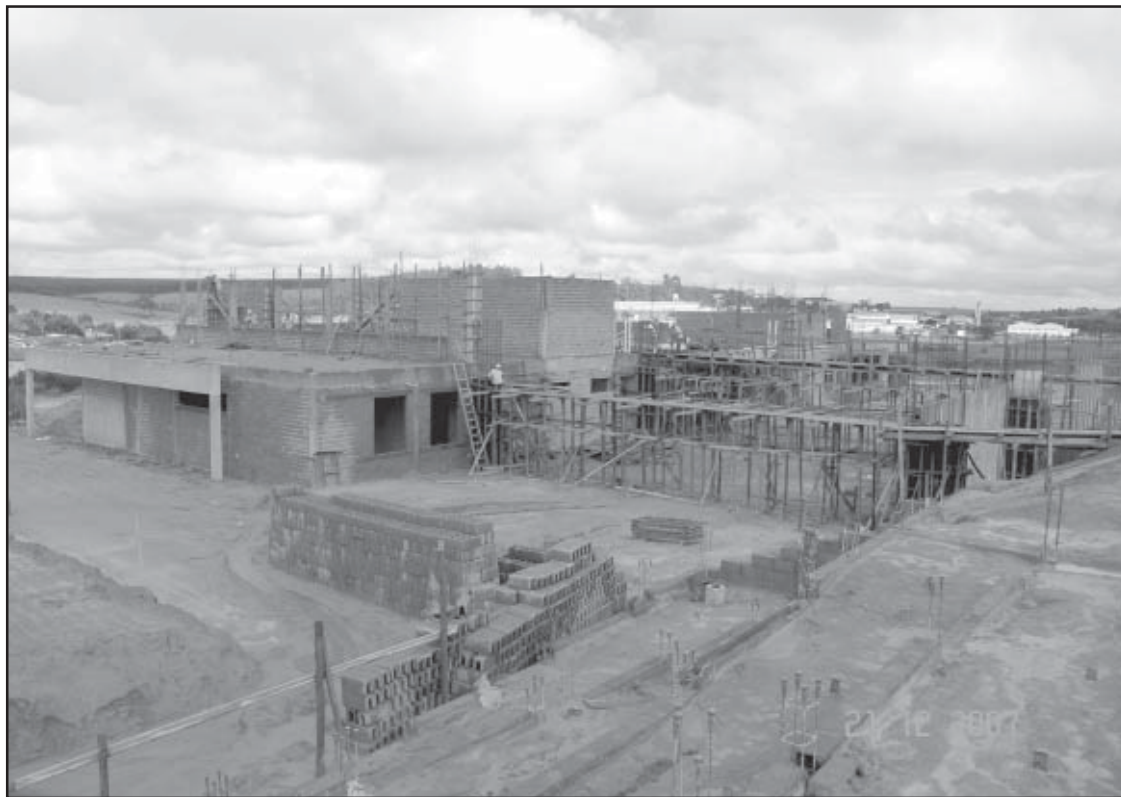
As obras da nova prefeitura seguem em ritmo acelerado

O projeto da administração municipal é implantar naquela região da cidade um grande complexo urbanístico.