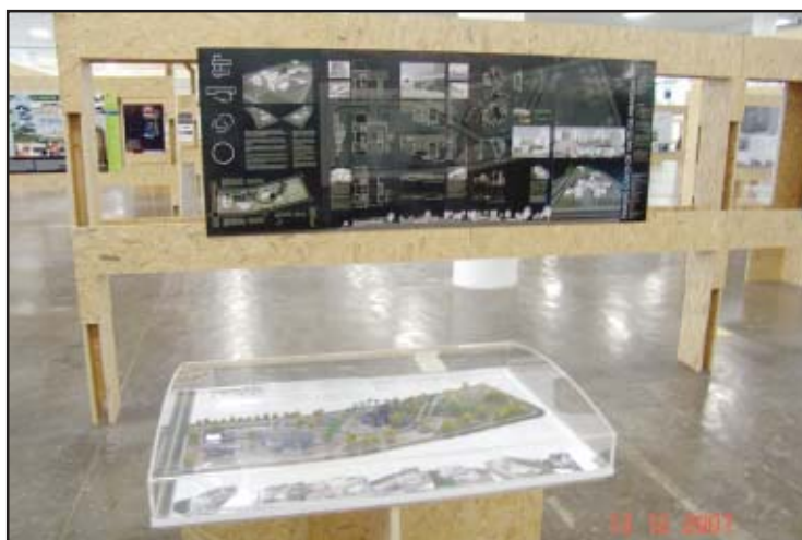
O projeto do Parque Cívico em exposição na bienal

Esses prédios vão integrar o setor cívico de um grande parque planejado para ser implantado naquela região da cidade, previsto para se tornar