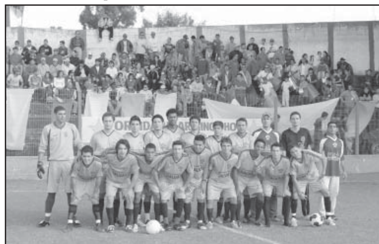
A Belarmino e sua torcida, grandes vitoriosas do Varzeano

A Barra FC foi a grande campeã de 2007 do Campeonato Municipal de Futebol da Segunda Divisão de Salto de Pirapora. Na final, a Barra venceu o Beira Rio nos pênaltis, após empate em 1 a 1 no tempo normal. As duas equipes subiram para a 1ª Divisão do ano que vem.