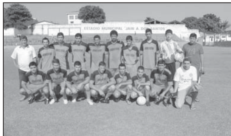
O time da Barra FC, campeão da Segunda Divisão