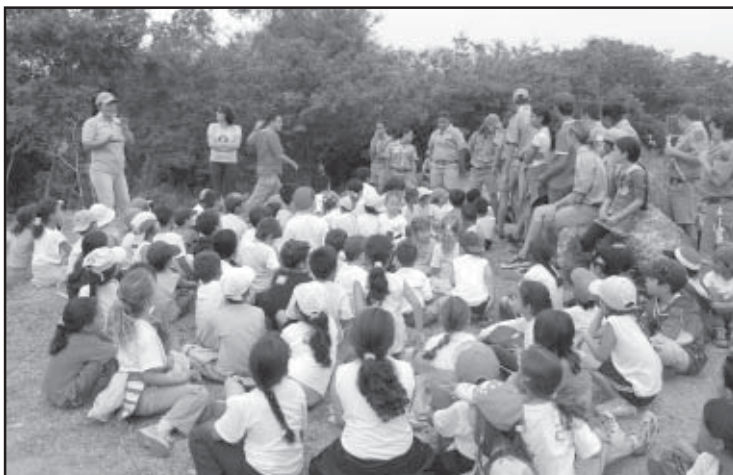
Ao todo, foram plantadas 1.500 mudas de árvores

mar a atenção da comunidade para a necessidade de preservação do meio ambiente. Foi esse o intuito da diretoria da educação ao promover a atividade.