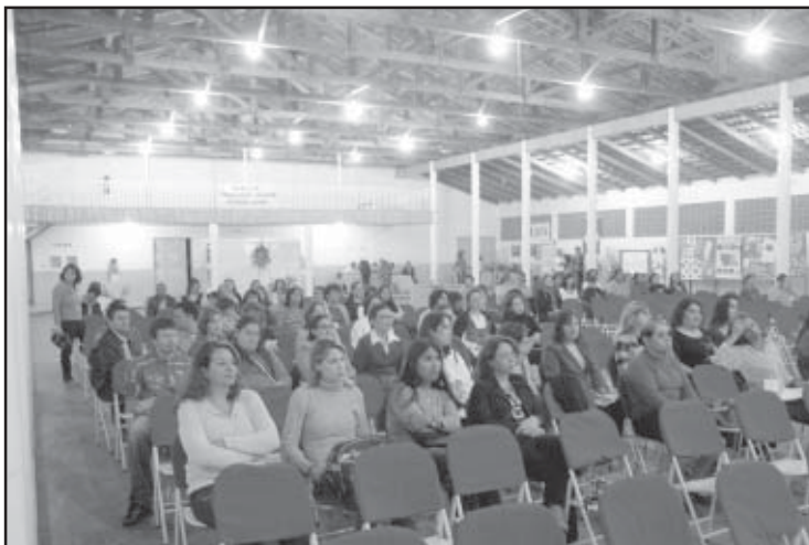
Participaram da 1ª Semana do Professor os docentes das escolas municipais, estaduais e particulares

O objetivo principal da semana do professor também foi de desenvolvimento da formação continuada e capacitação dos educadores de nossa cidade. Participaram do evento, educadores das escolas municipais, estaduais e particulares de Salto de Pirapora. Os professores palestrantes são membros da Universidade Federal de São Carlos (Ufscar), Uni-