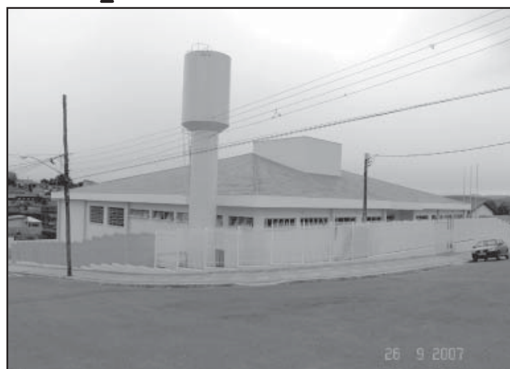
A escola do Jd. América vai funcionar já em 2008

As construções da nova Escola Municipal de Educação Especial e da nova Escola Municipal de Ensino Fundamental do Jardim América já estão prontas. A Prefeitura aguarda apenas a conclusão das licitações do mobiliário e equipamentos internos dos prédios que abrigarão as novas escolas para entrega-las à população.