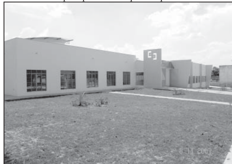
Acessibilidade está presente na nova escola especial

Exemplo disso, é a piscina aquecida que vai funcionar ali.