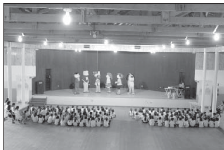
Apresentação da peça teatral turma Nosso Amiguinho

A peça foi apresentada no salão do recinto de festas em várias sessões no dia 17 de abril e um dos objetivos da escola com a atividade foi de dar andamento ao seu Projeto Leitura.