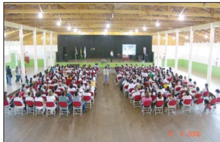
Quando detectada precocemente, a doença tem cura

Segundo o presidente da ONG, quando detectada precocemente, a hepatite "C" tem tratamento, inclusive gratuito e também tem cura. "Aliás, o hospital da Unesp, em Botucatu, interior de São Paulo, é referência e coloca o Brasil como o país com maior chance de cura da doença no mundo, com um índice de 52%.