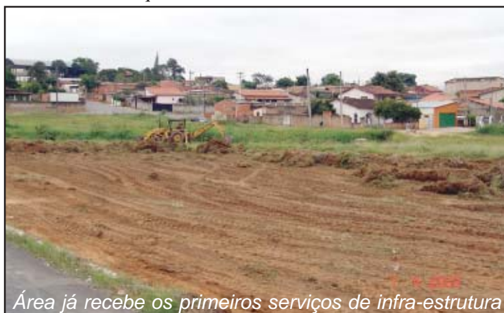
Área já recebe os primeiros serviços de infra-estrutura

Os recursos para a realização dos serviços de melhorias de infra-estrutura urbana foram obtidos mediante convênio assinado com o governo do Estado.