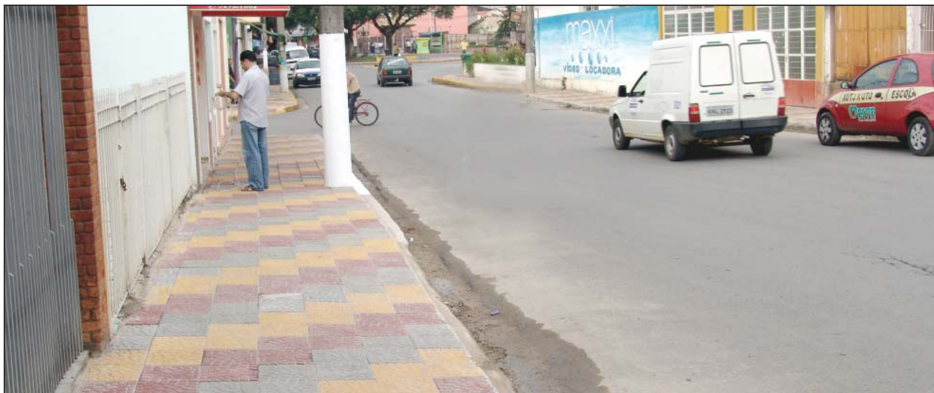
A rua Belarmino Cerqueira César é uma das beneficiadas nesta nova fase do plano de reurbanização de Salto de Pirapora

Nesta nova fase serão construídas e revestidas as calçadas em um total de 5.800 metros quadrados