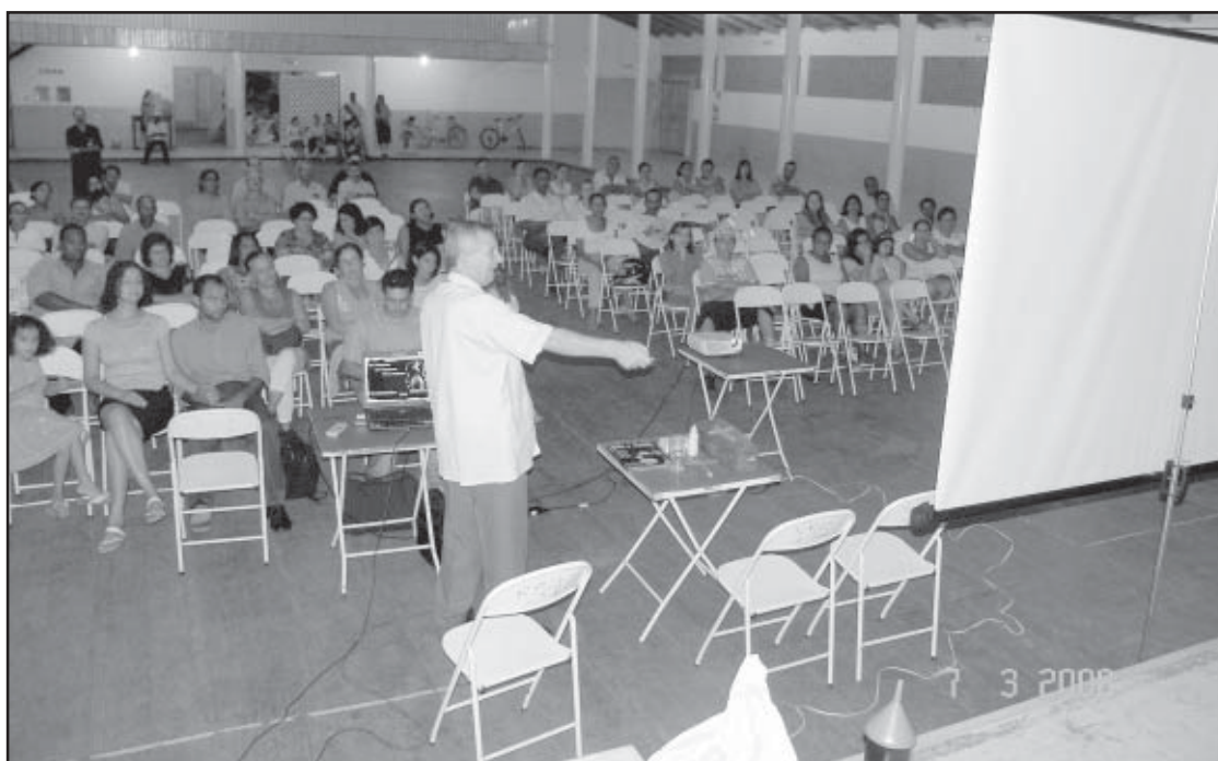
Os presentes ouviram atentamente as orientações durante as palestras no recinto

Segundo a Igreja Adventista, o Programa Nacional de Saúde visa melhorar a qualidade de vida das famílias. “Isso se faz necessário porque a saúde total somente é possível quando há o desenvolvimento harmônico do ser huma-