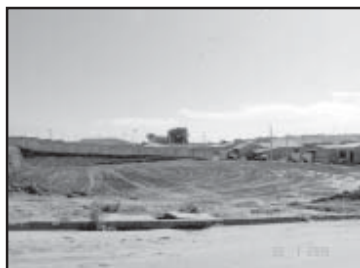
Área sendo preparada

As instalações da nova escola vão atender em sua to-