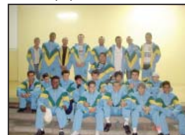
Parte da delegação

equipe sub-17, obteve a 15ª posição, na segunda divisão.