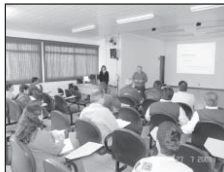
Palestra foi direcionada às entidades subvencionadas pela Prefeitura

A Secretaria de Finanças abordou desde a utilização dos recursos até a prestação de contas do dinheiro repassado. Participaram da palestra seis entidades subvencionadas.