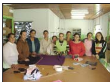
Cooperativa de costura passou por reestruturação

A conferência vai tratar também da temática compromissos e responsabilidades para assegurar proteção social pelo Sistema Único da Assistência Social (SUAS). Estará em discussão também na conferência o âmbito de responsabilidade municipal, as metas de gestão do SUAS, de financiamento, recursos humanos e controle social, implementados nestes últimos quatro anos, com a perspectiva de identificar os avanços, as dificuldades e os