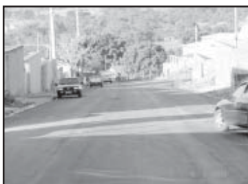
Todas as ruas asfaltadas

Isso representa o atendimento a uma antiga reivindicação dos moradores daquela comunidade.