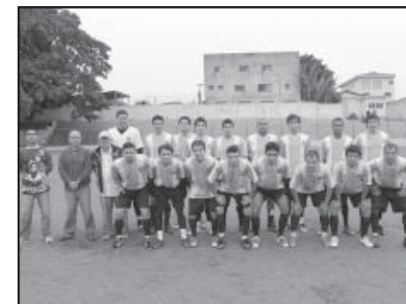
As equipes Teixeira FC e Belarmino Show finalistas do segundo turno da primeira divisão do Varzeano 2009. A vencedora fica com a taça Izaltino de Camargo "Zartão"