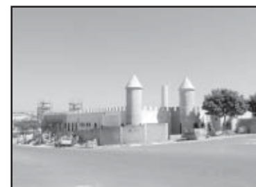
A nova creche vai ter capacidade para cem crianças com instalações amplas e modernas

O projeto arquitetônico da nova creche é baseado em um castelo medieval.