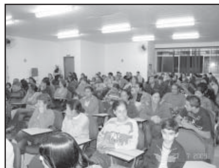
A palestra aconteceu no Centro de Referência da Assistência Social (CRAS)

A Polícia Militar colaborou com o Ambulatório de Saúde Mental para a realização do evento.