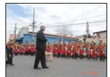
Banmasp em ação no aniversário da cidade

lugar; Corpo Coreográfico, 1º lugar; Baliza, 1º lugar.