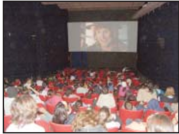
Crianças no cinema

Na primeira semana do mês de junho, 2500 (duas mil e quinhentas crianças) da rede municipal de Salto de Pirapora foram ao cinema gratuitamente.