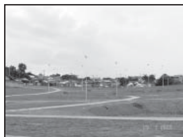
Pistas de caminhada

A construção segue o mesmo padrão e características arquitetônicas das áreas de lazer implantadas en-