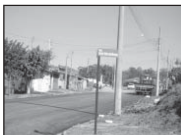
Serviço incluiu sinalização

O bairro, que fica na área urbana do município, recebeu 11.517,34 metros quadrados de pavimento asfáltico. Essa obra foi possível graças a uma parceria entre