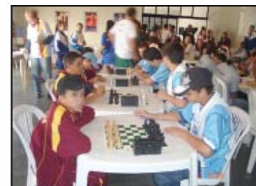
Equipe de xadrez

No futebol, Salto de Pirapora participando com uma