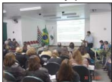
A primeira conferência

A Secretaria da Promoção Social vai realizar, no dia 6 de agosto, a 2ª Conferência Municipal de Assistência Social. O evento vai acontecer no Centro de Referência da Assistência Social (CRAS) e vai reunir autoridades políticas, conselheiros, técnicos e usuários da área. A abertura da conferência está prevista para às 18h30. O tema da conferência este ano será "Participação e con-