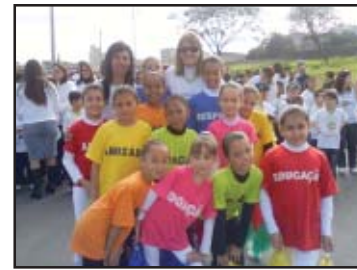
Escola adotou o projeto as diferenças e particularidades humanas (bullying); e ser um cidadão consciente dos seus direitos e deveres.

O lema da EMEIEF Jana Marum dos Santos é de surpreender o mundo com a educação e gentileza de nossas crianças. A equipe escolar abraçou o projeto Gentileza gera Gentileza e, unidos, educadores, funcionários, alunos, pais e comunidade estão desenvolvendo um belo trabalho tendo como seu foco principal: solidariedade, respeito, ética, compreender e aceitar com amor