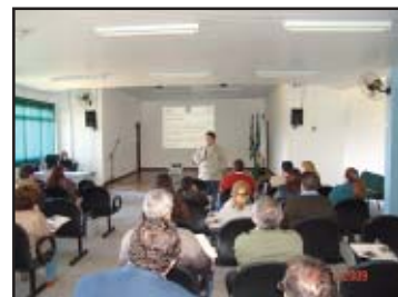
Palestra do meio ambiente