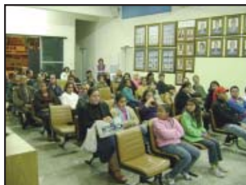
Entrega dos certificados exposição dos trabalhos dos alunos dos cursos.

Nos dias 13 e 14 de julho, o setor promoveu uma