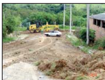
Recuperação de ruas