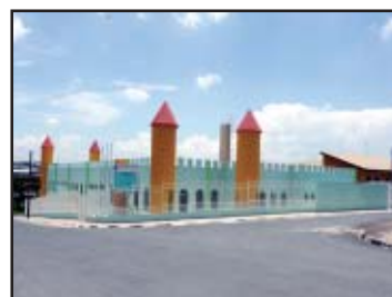
Nova creche B. Vista