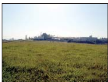
Nova área industrial