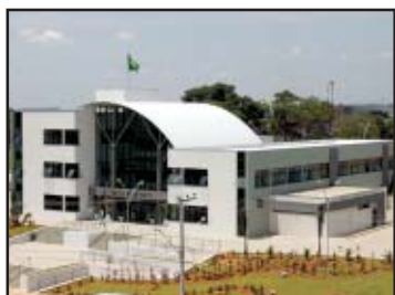
Novo Paço Municipal