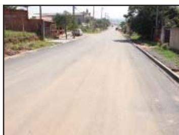
Asfalto de graça no S. Manoel