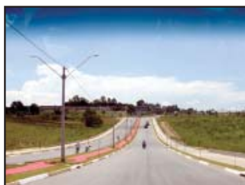
Nova Avenida C. Largo