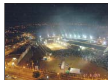
Melhorias no recinto