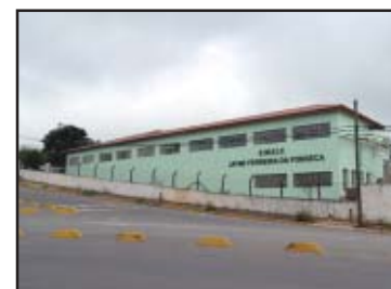
Reforma na escola do Paulistano