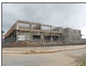
Escola no Maria Clara