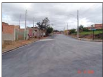
Asfalto de graça no Alvorada