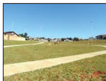
Áreas de lazer