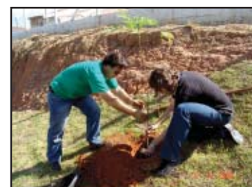
Plantio de árvores