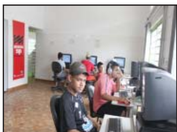
Acessa São Paulo