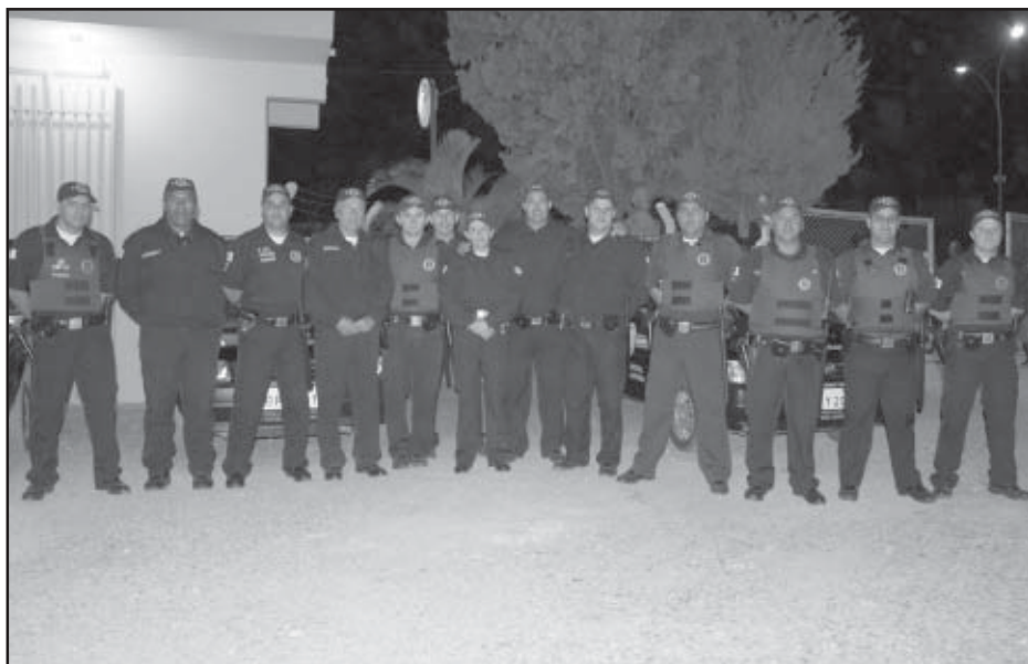
Guarda Municipal esteve presente em todos os momentos das festas