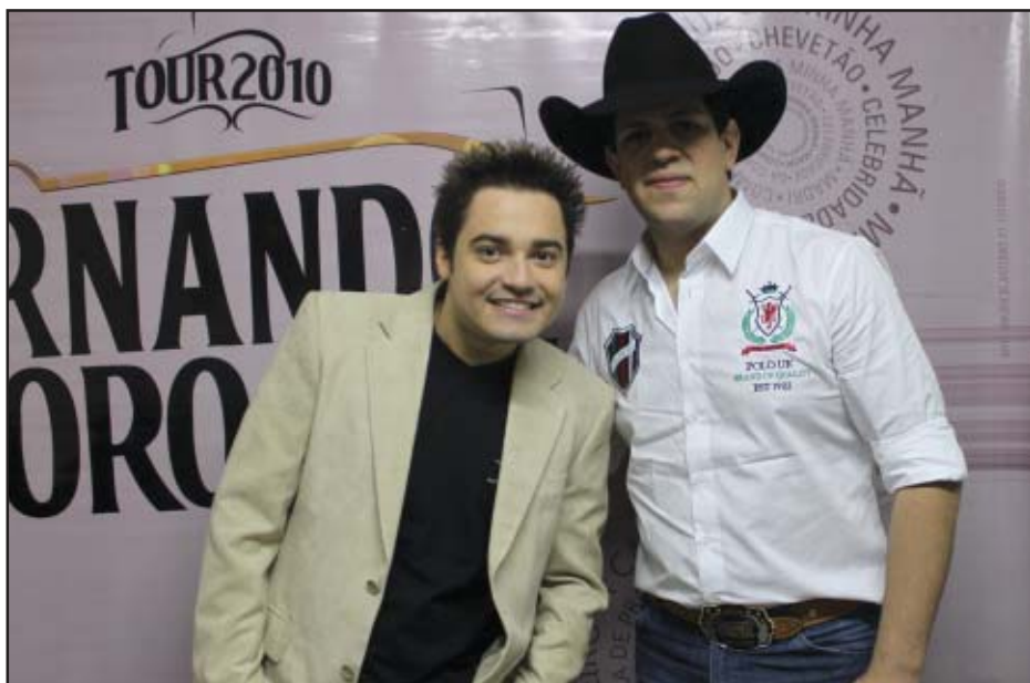
A população de Salto de Pirapora pode presenciar no encerramento das festas, uma mega produção no show de Fernando e Sorocaba, sendo considerado pela grande maioria da população o maior de todos os tempos, levando seus milhares de fãs ao delírio