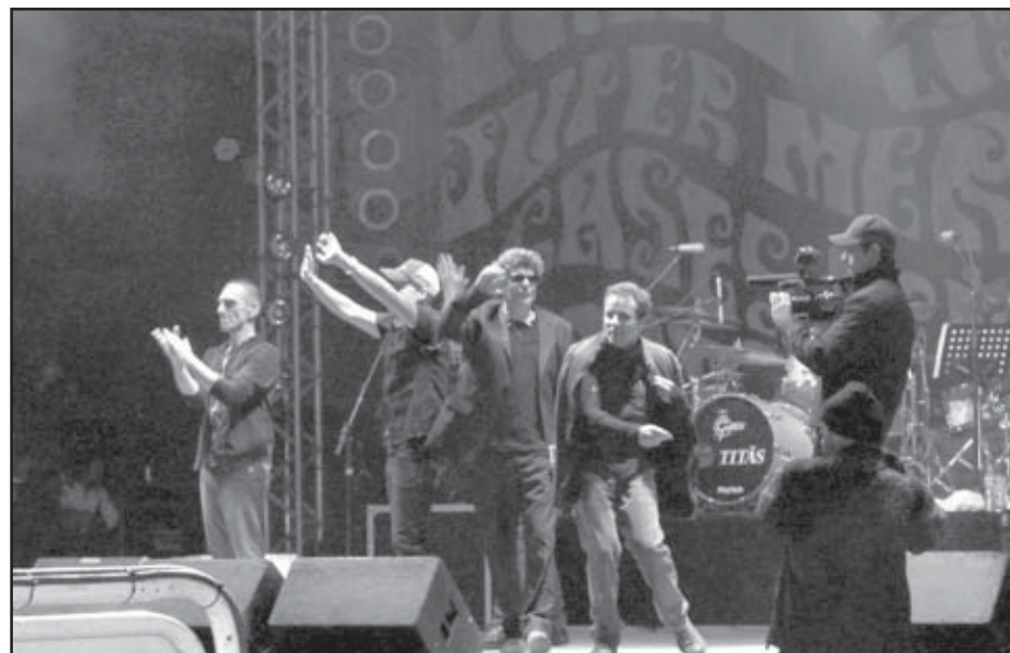
Show com a banda Titãs animou os fãs