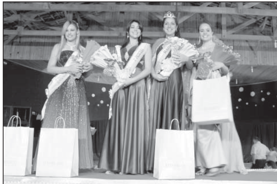
O concurso da rainha da festa foi muito disputado

O show com Fernandinho foi realizado no palco principal do recinto e