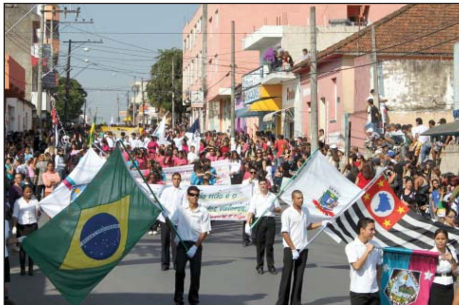
Ruas lotaram durante o desfile cívico no dia da cidade