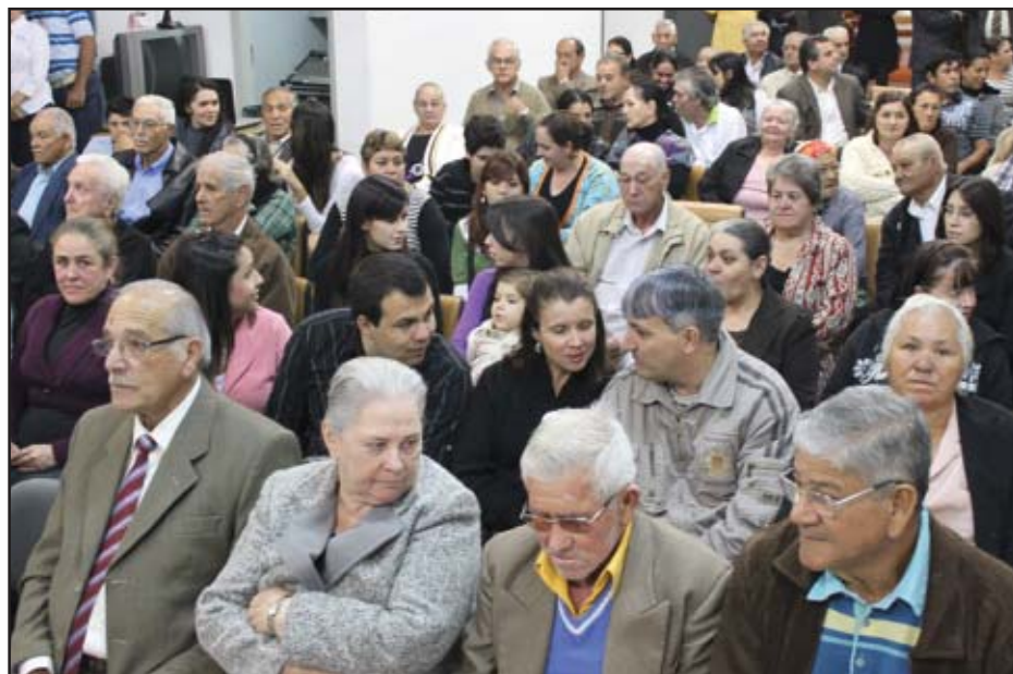
Sessão solene homenageou cidadãos ilustres de Salto de Pirapora

De acordo com o decreto legislativo que instituí a Comenda Honorífica 24 de Junho, anualmente serão homenageadas dezenas de pessoas que vivem há mais de 50 anos em Salto de Pirapora.