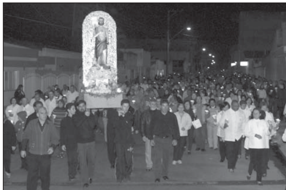
Fazendo parte dos festejos em comemoração do aniversário e padroeiro da cidade São João Batista, a Igreja Católica realizou Santa Missa e procissão pela ruas centrais da cidade, acompanhada por milhares de fiéis

A EDIÇÃO ESPECIAL DA IMPRENSA OFICIAL DO ANIVERSÁRIO DA CIDADE