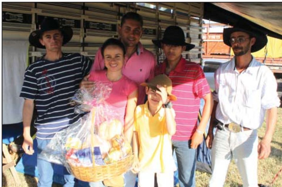
Visitantes acampados no recinto receberam cestas de café da manhã