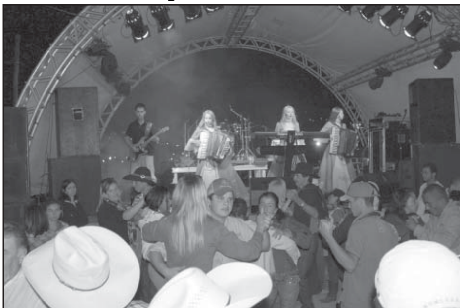
As Garotinhas de Ouro animaram o público durante as tardes