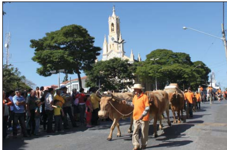
O desfile de cavaleiros já é tradição em Salto de Pirapora