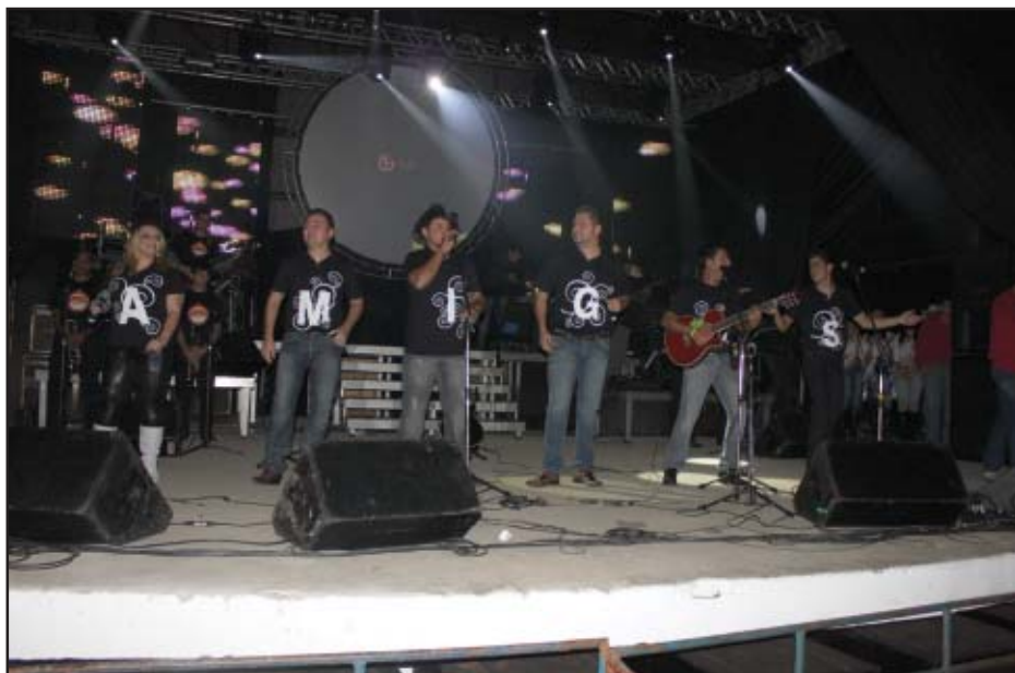
O show amigos aconteceu dia 24