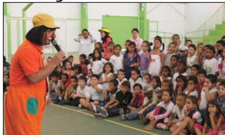
Palhaço fez a alegria das crianças nas escolas