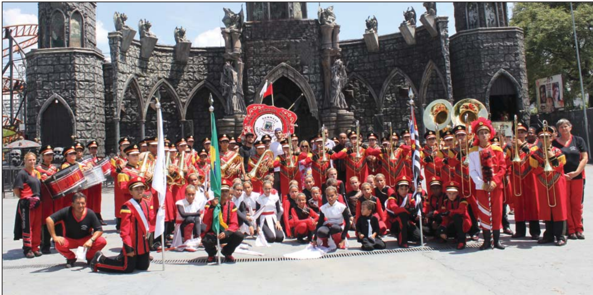
A Banda Marcial Municipal de Salto de Pirapora (Banmasp) conquistou o título de campeã nacional do concurso de bandas e fanfarras

A Banmasp -Banda Marcial Municipal de Salto de Pirapora, foi recebida no último final de semana com festa pelas autoridades e população pela brilhante conquista no domingo, 17, pelo título de campeã nacional na cidade de Franca/SP. A banda competiu na categoria juvenil representando Salto de Pirapora contra outras cidades e estados brasileiros. Além do título, também se destacaram o Corpo Musical e Baliza que obtiveram o 1º lugar, além do Corpo Coreográfico e Mor de Comando que ficaram com a terceira colocação.