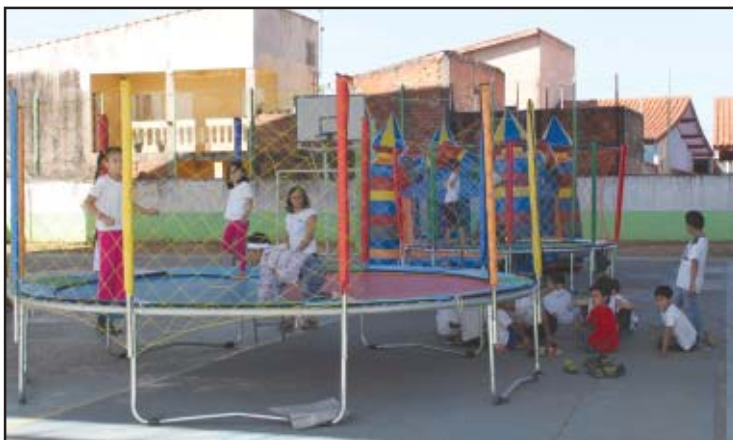
A cama elástica foi um dos brinquedos preferidos

Com muita diversão e atividades recreativas foi comemorado o Dia das Crianças em Salto de Pirapora. O evento foi concentrado nas escolas e creches municipais, onde brinquedos como camas elásticas, casas de bolinhas, pulas-pulas e outros foram instalados, além da apresentação de palhaços e grupos de danças, para a alegria da criançada. Promovidas pela Prefeitura as atividades foram realizadas nos períodos da manhã e da tarde, além disso a festa do Dia das Crianças contou com um cardápio especial, como bolos, sanduíches, doces e sucos.