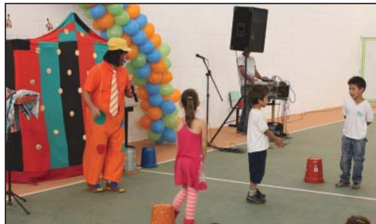
Muitas brincadeiras fizeram parte da festa das crianças