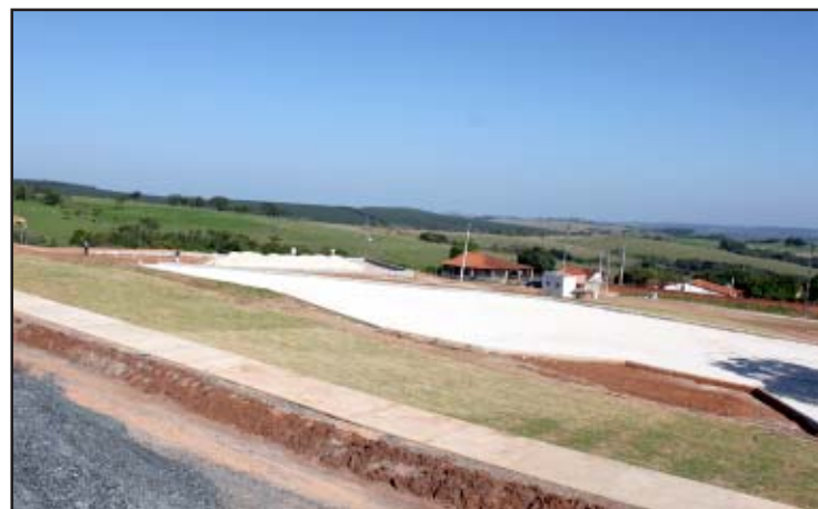
Prosseguem em ritmo acelerado as obras no São Manoel