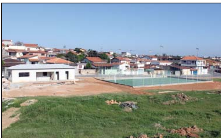
O terreno entre os jardins Áurea e Agenor está recebendo quadra poliesportiva e uma moderna pista de bicross