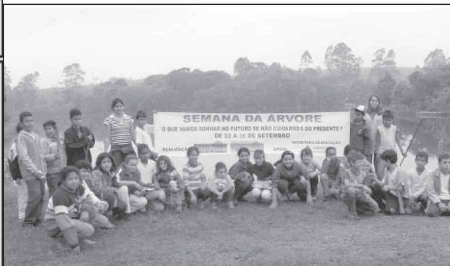
Conscientização é uma das principais ações da secretaria do ambiente

Vale lembrar que o plantio de árvores continuará sendo realizado durante todo o ano, pois a Secretaria Municipal do Meio Ambiente espera plantar mais de 2 mil árvores até o final de 2011.