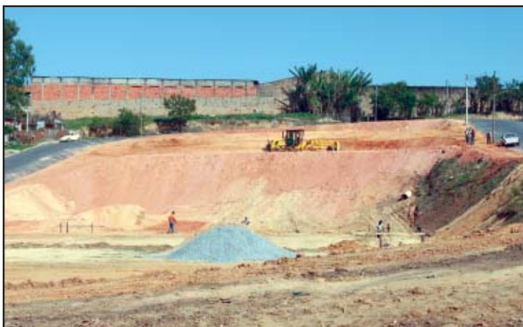
O Santa Maria vai ganhar uma moderna área de recreação

Pensando na qualidade de vida da população, a prefeitura tem intensificado ações e obras em diversos bairros da cidade. A exemplo dos bairros Dona Madalena, Jardim Paulistano e Jardim Agenor, que já receberam áreas de lazer, agora a administração municipal está construindo dois novos espaços de recreação, nos bairros São Manoel e Santa Maria, nos mesmos moldes das áreas já existentes, com academia a céu aberto e brinquedos. O governo municipal também já deu início as obras no terreno entre os jardins Áurea e Agenor, onde estão sendo construídas uma quadra poliesportiva, pista de bicross, além de estar previsto para o próximo ano a construção de uma pista de skate. Outro bairro que está sendo beneficiado é o Jardim Teixeira, que está recebendo uma quadra poliesportiva para atender a comunidade daquela localidade.