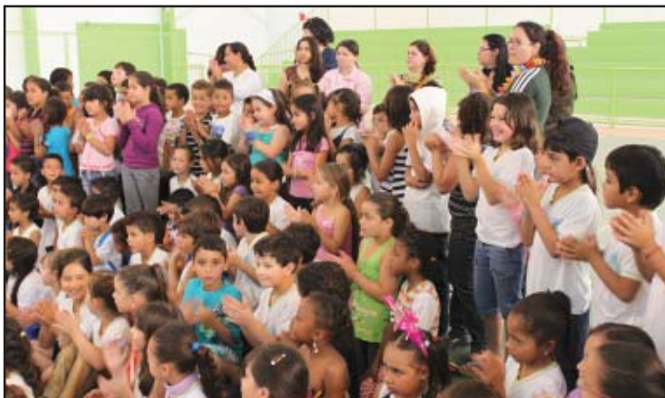
As crianças divertiram-se muito nas escolas