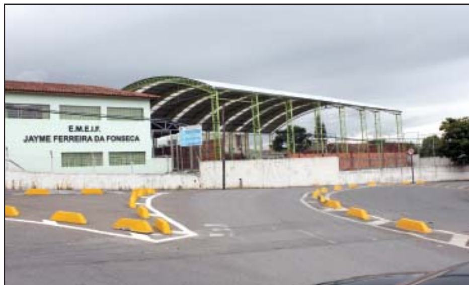
Na escola municipal Jayme Ferreira da Fonseca, no Jd. Paulistano, as obras de cobertura da quadra estão em fase final