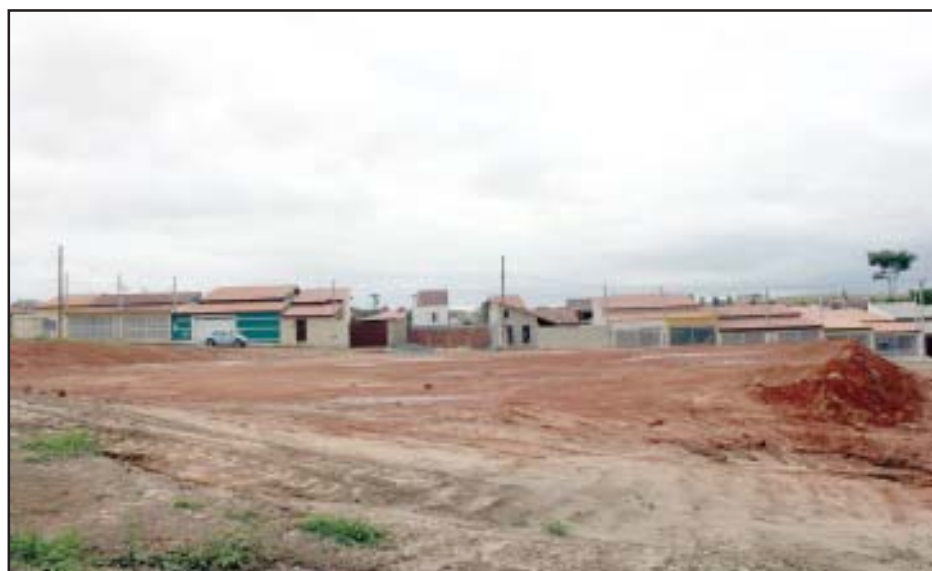
No Jd. Agenor dos Santos, a área onde será construída uma creche municipal já está preparada para receber a obra