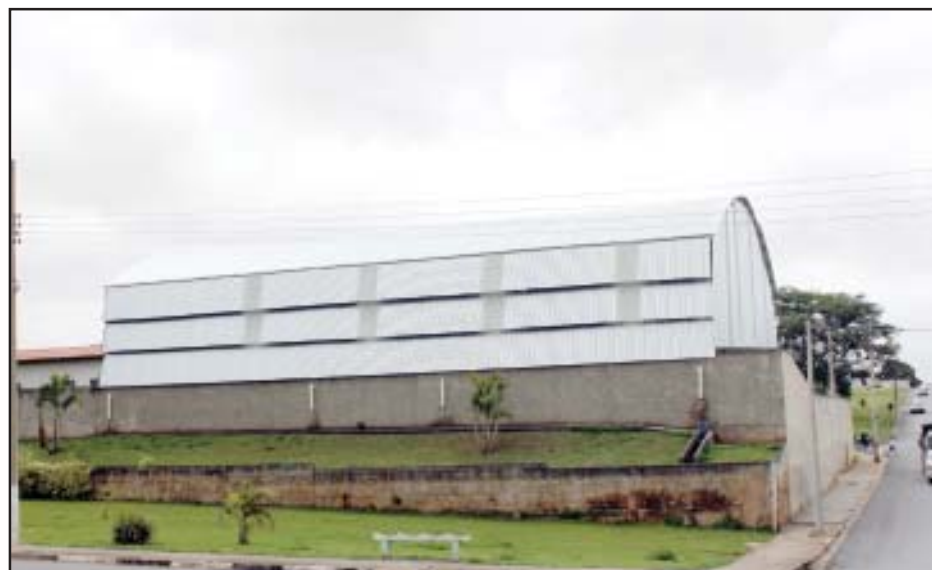
A Prefeitura já concluiu as obras de cobertura das quadras da escola especial e também da escola Professor José Marcello