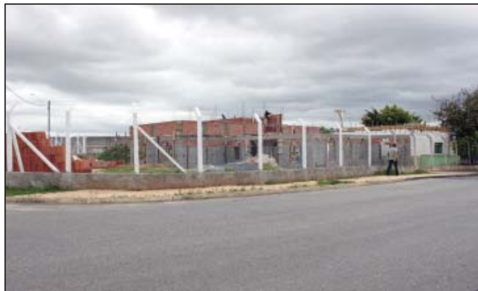
Na creche municipal Nair Guilherme, no Jd. Ana Guilherme, as obras de ampliação e reforma seguem em ritmo acelerado