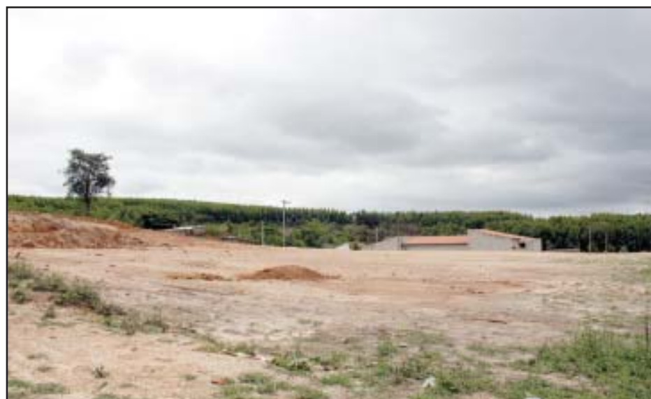
No Jd. Cachoeira a Prefeitura também já prepara uma área onde será construída uma creche municipal